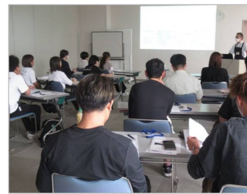
講義「図書館の概要」(図書館長)