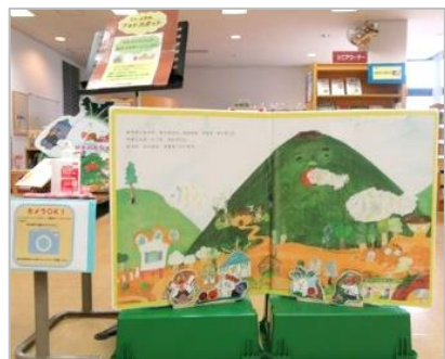
『やまのおなか』に登場する野菜たちといっしょに、「ハイ、チーズ！」